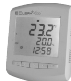
EClerk-Eco-M-RHT-11 (с ЖК дисплеем)