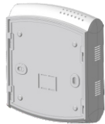
С пластиковым кронштейном

Прибор EClerk-Eco-M без внешнего интерфейса, а также с интерфейсом: WiFi, LoRaWAN, Nb-IOT, Bluetooth поставляется с пластиковым кронштейном. Приборы других модификаций (с проводным интерфейсом) поставляются с металлическим кронштейном.